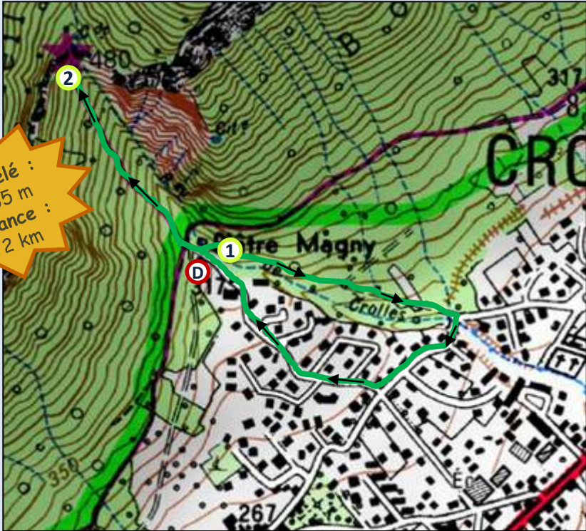
Carte IGN TOP25 n° 3334 OT